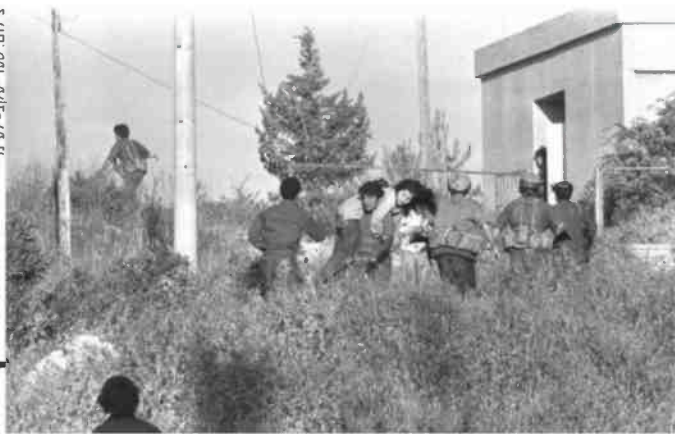
בפיגוע הטרור במעלות זחל דיין בעצמו אל המבנה והציץ דרך החלון. חילוץ הפצועים מבית הספר

באים להצנעם בדין. "ועדת ארנט בקעה שהמדע"ן הטעה את דיין, אבל בסופו של דבר הוא היה שר הביטחון. כבר בזמן המלחמה הוא ביקש להגיש לגולדה את התפטרותו, ולדעתו הוא שנה בכך שאדין חוס הקיבות לא הניח את המפתחות. אני יכול להבין את ההצדקות שלו, אבל אני חושב שזה היה לא נכון מוסרית וגם טעות פוליטית. הציפייה ב'73 הייתה שהרמת הזו של משה דיין תופיע שוב תציל את המצב, ובמקום זה היא קרסה. זה ממש סיפור טרגי. כששנת הדמים התייחסו אליו כאל משיח, ואחרי יום כיפר - רוצח, בוגד. הוא הפך להיות האדם הכי מושקע שגוי. ב-1975 בגין אהה את דיין וישב במזנון הבנסת לבר, אף אחד לא רצה לשבת לידו, ואמד שכך חלפת תהילת עלים. בהמשך הוא הביא את דיין לממשלה שלו. כי השם של דיין בעולם עדיין היה גדול, ובגין היה צריך את הלגיטימציה הבינלאומית שבהאיתו". בימינו זוכרים עד היום לדין את ההחלטה הגדולה שלו לאחד שירותי ירושלים, כשהחליט שהאחיות על הר הבית תיוותר בידי החוק, ותמוך באיסור על תפירת יהודים. "אני חושב שהוא צדק, גם אם חלק מאנשי הימין ידעו עליו. לדעתו הוא הבין לעומק את הרגישות הדתית של הצד השני והחליט שהצדו העליון מבחינתו הוא לא להפוך את הסכסוך לסכסוך דתי. אנתנו חווים את זה עכשיו במידת מה, אבל דיין ניסה למנוע את זה. שמיר גורס, אנכ, שהנחית דיין 'לעזוב את כל הוותיקן הזה' שיתנה למפקד פיקוד המרכז עוזי נרקיס לאחד כיתורו העיר העתיקה, לא בענה מולול בקודשי היהדות: נרקיס באותו שלב רצה לפרוץ פנימה, היין כבר היה לתפוס תחילה את הדרך ידיו, כדי למנוע אפשרות של התקפת גנג דרבינו.