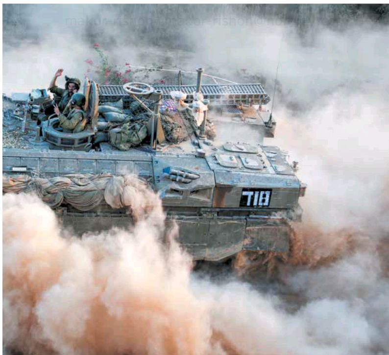
מחזיר למרכז הדיון את מושג ההכרעה ואת מרכיב התמרון היבשתי. חיילי צה"ל בכפיסה לעזה במבצע צוק איתן